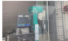
ヘッドライトテスター