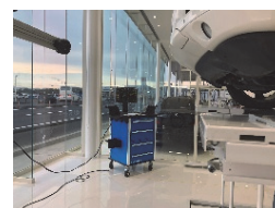
光学式アライメントテスター