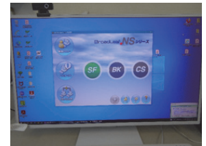
OSS対応ソフトウェアの画面表示