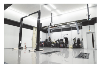
ホイールバルンサー