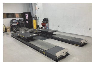
マルチアライメントリフト