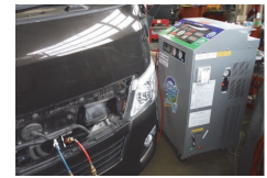
フロンガス交換機