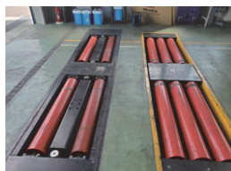
コンビネーションテスター