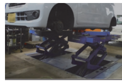
ファンタスリフト