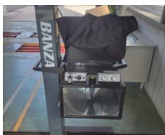
ヘッドライトテスター